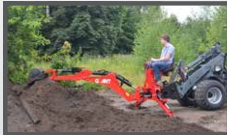
NL KRAANARM HYDR. EN EXCAVATOR ARM HYDR. DU BAGGERARM FR BRAS EXCAVATEUR