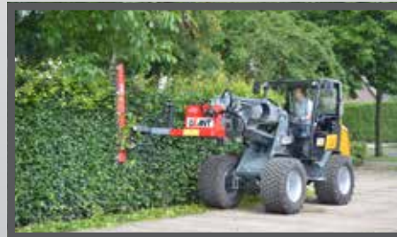
NL HEGGENSCHAAR EN HEDGE CUTTER DU HECKENSCHERE FR TAILLE-HAIE