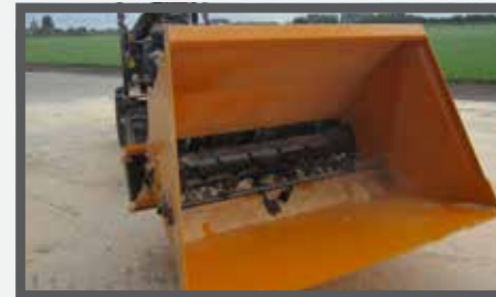
NL VERDEELBAKKEN (MVB) EN DIVIDE BUCKETS (MVB) DU VERTEILSCHAUFEL (MVB) FR BENNES DE DISTRIBUTION (MVB)