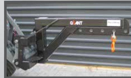
NL JIPPEN EN JIB BOOMS DU AUSLEGARM FR BRAS RADIAUX