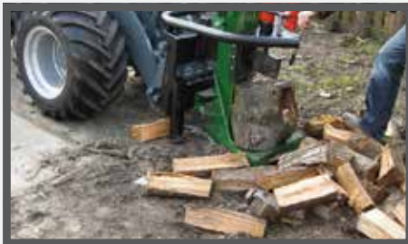
NL HOUTKLOOFMACHINE EN LOG SPLITTER DU HOLZSPALTER FR FENDEUSE À BOIS