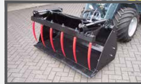
NL PELIKAANBAKKEN EN PELICAN BUCKETS DU SCHUTTSCHAUFEL FR BENNES PÉLIKAN