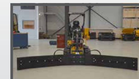
NL VOER- MESTSCHUIF COMPACT EN FEED- AND MANURESCRAPER COMPACT DU FUTTER- UND SCHMUTZSCHIEBER FR LAME À FOURRAGE - FUMIER COMPACT