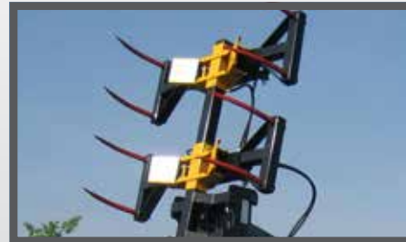
NL BALENGRIJPERS EN BALE CLAMPS WITH TEETH DU BALLENZANGE FR GRAPPINS POUR BALLES