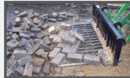
NL TEGELRIEKEN EN BROKEN STONE FORK DU STEINENGABEL FR FOURCHES À CARREAUX