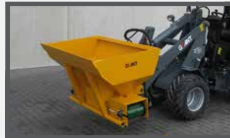
NL DIEPSTROOISELBAKKEN (DSB) EN DEEP-LITTER BUCKETS (DSB) DU TIEFSTREUSCHAUFEL (DSB) FR ÉPANDEURS PROFONDS (DSB)