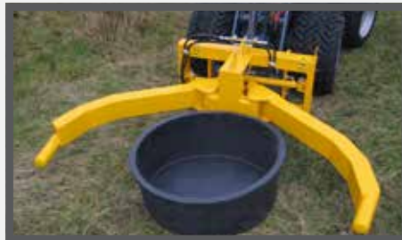
NL POTTENKLEMMEN EN POT CLAMPS DU GREIFZANGE FR GRIFFES À POTS