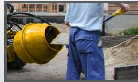
NL BETONMOLEN EN CONCRETE MIXER DU BETONIERMACHINE FR BÉTONNIÈRE