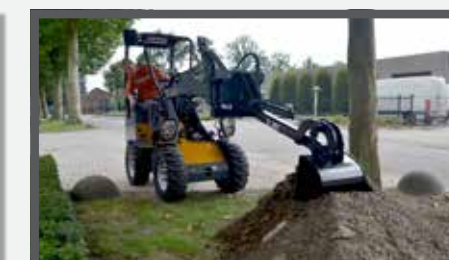
NL GRAAFARM COMPACT EN DIGGER ARM COMPACT DU BAGGERARM KOMPAKT FR BRAS EXCAVATEUR COMPACT