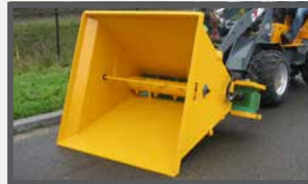
NL VERDEELBAKKEN (VDB) EN DIVIDE BUCKETS (VDB) DU VERTEILSCHAUFEL (VDB) FR BENNES DE DISTRIBUTION (VDB)