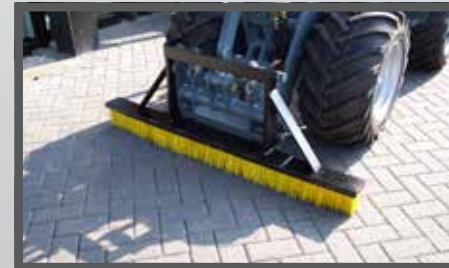
NL INVEEGBORSTELS EN BRUSH DU KEHRBÜRSTE FR BROSSES À BALAYER