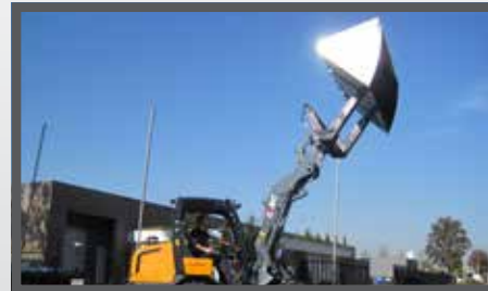
NL HOOGKIEPBAKKEN EN HIGH TIP BUCKETS DU HOCHKIPPSCHAUFEL FR BENNES BASCULANTES