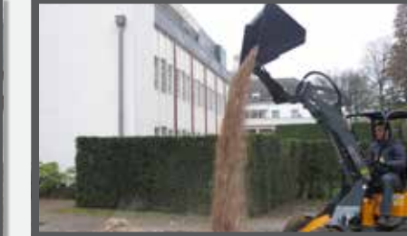
NL HOOGKIPBAKKEN COMPACT EN HIGH TIP BUCKETS COMPACT DU HOCHKIPPSCHAUFEL KOMPAKT FR BENNES BASCULANTES COMPACT