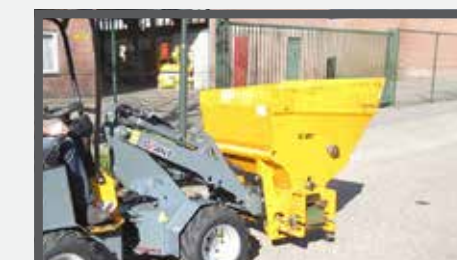
NL VERDEELBAKKEN COMPACT EN DIVIDE BUCKETS COMPACT DU VERTEILSCHAUFEL KOMPAKT FR BENNES DE DISTRIBUTION