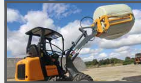
NL BALENKLEMMEN EN BALE CLAMPS DU BALLENZANGE FR GRIFFES POUR BALLES