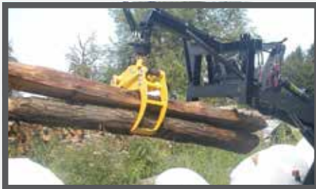
NL HOUTKLEMMEN EN WOOD CLAMPS DU HOLZKLEMMER FR GRIFFES À BOIS