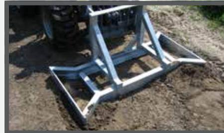
NL EGALISATIEFRAMES EN LEVELLING FRAME DU PFLASTERVERLEGEZANGE FR CADRES D'ÉGALISATION