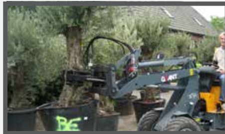
NL BOMENKLEMMEN EN TREE CLAMPS DU BAUMKLEMMER FR GRIFFES À ARBRES