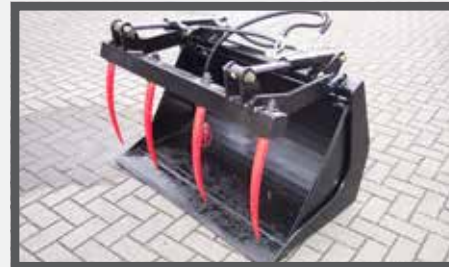
NL PUINBAKKEN MET KLEM EN WASTE BRICK BUCKETS WITH CLAMP DU SCHUTTSCHAUFEL MIT ZANGE FR BENNES À GRAVATS, AVEC GRIFFE