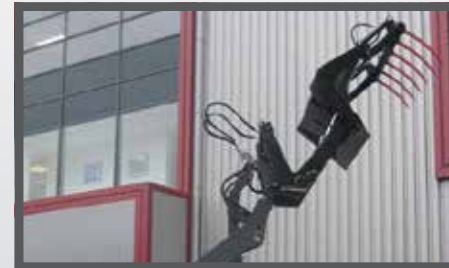
NL HOOGKIEP PELIKAANBAKKEN EN HIGH TIP PELICAN BUCKETS DU HOCHKIPP PELIKAN SCHAUFEL FR BENNES PÉLIKAN BASCULANTES