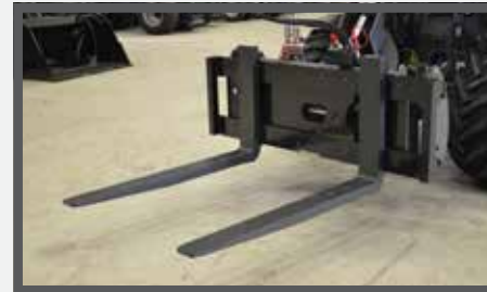
NL PALLETVORKEN SIDESHIFT EN PALLET FORKS SIDESHIFT DU HYDRAULISCHE PALETTEGABEL FR FOURCHES À PALETTES HYDRAULIQUE