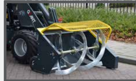
NL VOERVIJZEL EN FOOD AUGER DU FUTTERAUFBEREITER FR L'UNITÉ DE PRÉPARATION DU FOURRAGE