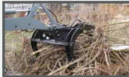
NL HOUTKLEMMEN HORIZONTAAL EN WOOD CLAMPS HORIZONTAL DU HOLZKLEMMER HORIZONTAL FR GRIFFES À BOIS HORIZONTALES