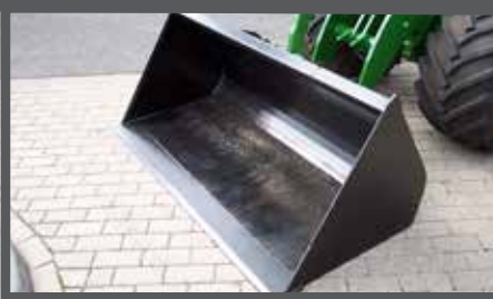
NL GRONDBAKKEN EN EARTH BUCKETS DU ERD SCHAUFEL FR PELLES À TERRE