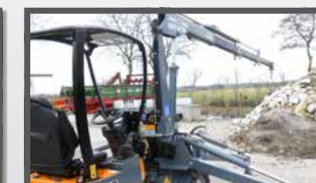
NL KRAAN ARM COMPACT EN CRANE ARM COMPACT DU KRANARM KOMPAKT FR GRUE BRAS COMPACT

ANY GIANT ATTACHMENT CAN BE FITTED WITH A COMPACT HITCH