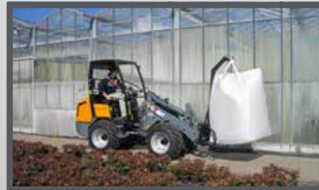
NL BIG BAG HAARKARMEN EN BIG BAG LIFTING ARMS DU BIG BAG HAKEN FR BRAS À CROCHETS POUR BIG BAGS