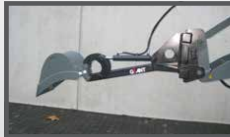
NL GRAAFARM EN DIGGER ARM DU BAGGERARM FR BRAS EXCAVATEUR