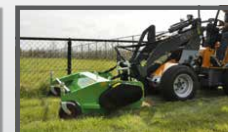
NL KLEPELMAAIERS COMPACT EN FLAIL MOWERS COMPACT DU SCHLEGELMULCHER KOMPAKT FR FAUCHEUSE À FLÉAU COMPACT