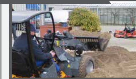
NL PUINBAKKEN COMPACT EN WASTE BRICK BUCKETS COMPACT DU SCHUTTSCHAUFEL FR BENNES À GRAVATS COMPACT