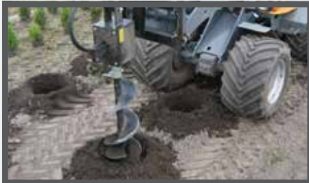
NL GRONDBOREN HYDR. EN HYDRAULIC EARTH DRILLS DU ERDBOHRERÄT FR TARIÈRES HYDRAULIQUES