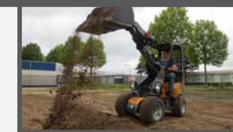
NL GRONDBAKKEN COMPACT EN EARTH BUCKETS COMPACT DU ERDSCHAUFEL KOMPAKT FR PELLES À TERRE COMPACT