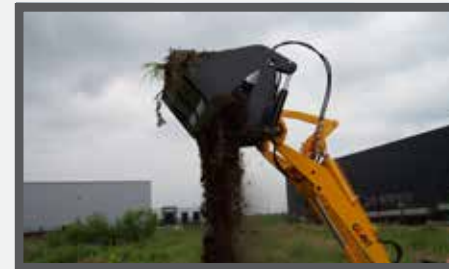
NL 4 IN 1 BAKKEN EN 4 IN 1 BUCKETS DU DROTTSCHAUFEL 4:1 FR PELLES 4 EN 1