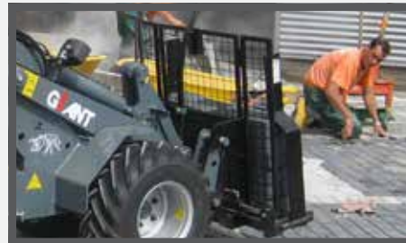
NL STENENKLEMMEN EN STONE CLAMPS DU STEINZANGE FR GRIFFES À PIERRES