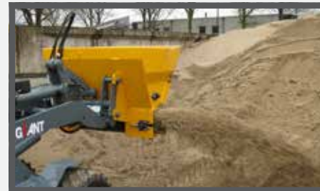
NL VERDEELBAKKEN (ZVDB) EN DIVIDE BUCKETS (ZVDB) DU VERTEILSCHAUFEL (ZVDB) FR BENNES DE DISTRIBUTION (ZVDB)