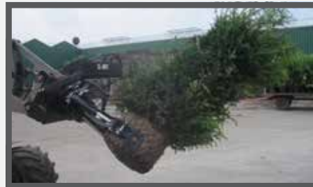
NL KLUITENKLEMMEN EN ROOT BALL CLAMPS DU WURZELBALLENKLEMMER FR GRIFFES À ARBRES