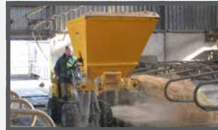
NL VERDEELBAKKEN (ZV) EN DIVIDE BUCKETS (ZV) DU VERTEILSCHAUFEL (ZV) FR BENNES DE DISTRIBUTION (ZV)