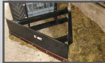
NL VOER- MEST PIJLSCHUIF EN FEED- AND MANURESCRAPER DU FUTTER- UND SCHMUTZSCHIEBER FR LAME À FOURRAGE - FUMIER