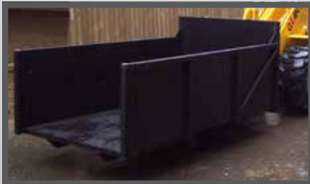
NL PAARDENMESTBAKKEN EN MANURE CONTAINER DU CONTAINERSCHAUFEL FR BENNES À FUMIER DE CHEVAL