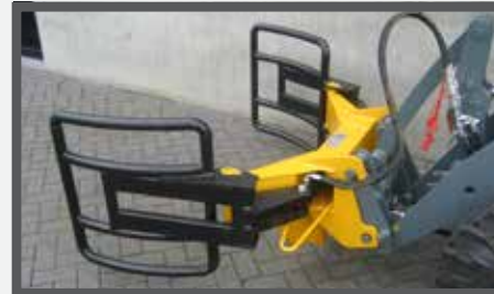
NL BALENKLEMMEN EN BALE CLAMPS DU BALLENZANGE FR GRIFFES POUR BALLES