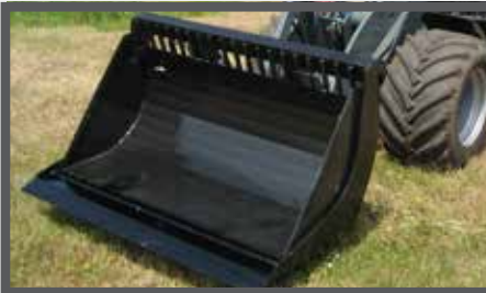
NL PUINBAKKEN EN WASTE BRICK BUCKETS DU SCHUTTSCHAUFEL FR BENNES À GRAVATS