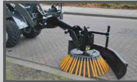
NL ONKRUIDBORSTELS EN WEED BRUSH DU WILDKRAUTBÜRSTE FR BROSSES POUR MAUVAISES HERBES