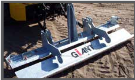
NL MANEGVLAKKERS EN LEVELLERS DU REITBAHNPLANNER FR HERSES POUR MANÈGES