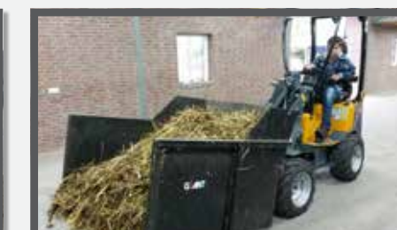
NL MEST CONTAINER COMPACT EN MANURE CONTAINER COMPACT DU CONTAINERSCHAUFEL KOMPAKT FR BENNES À FUMIER DE CHEVAL