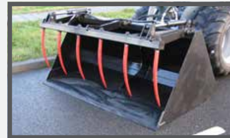
NL VOLUME BAKKEN MET KLEM EN HIGH VOLUME BUCKETS WITH CLAMP DU LEICHTGUTSCHAUFEL MIT ZANGE FR BENNES POUR VOLUME, AVEC GRIFFE