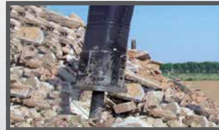
NL HYDR. SLOOPHAMER EN HYDR. SLEDGEHAMMER DU HYDR. BRECHER FR HYDR. BRISEUR