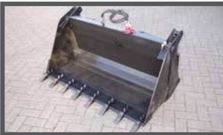
NL 4 IN 1 BAKKEN GELASTE TANDEN EN 4 IN 1 BUCKETS WELDED TEETH DU DROTTSCHAUFEL 4:1 GESCHWEIST REISSZÄHNE FR PELLES 4 EN 1 DENTS SOUDÉES