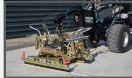
NL MACHINALE LEGKLEMMEN EN STONE INSTALLATION CLAMP DU PFLASTERVERLEGEZANGE FR GRIFFES DE DÉPÔT MACHINALES