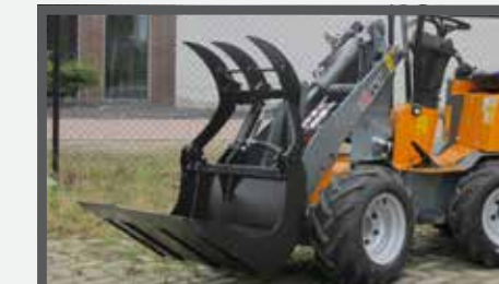
NL PELIKAANBAKKEN COMPACT EN PELICAN BUCKETS COMPACT DU PELIKANSCHAUFEL COMPACT FR BENNES PÉLIKAN COMPACT