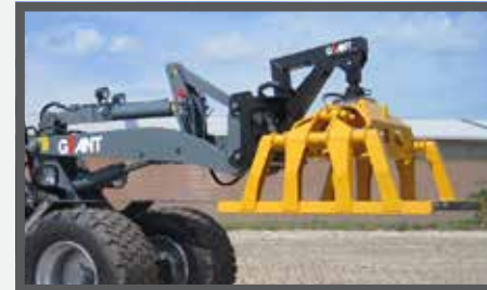
NL PAKKENKLEMMEN EN STONE CLAMP DU STEINZANGE FR GRIFFE À PAQUETS