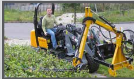
NL HEGGENSCHAAR EN HEDGE CUTTER DU HECKENSCHERE FR TAILLE-HAIE