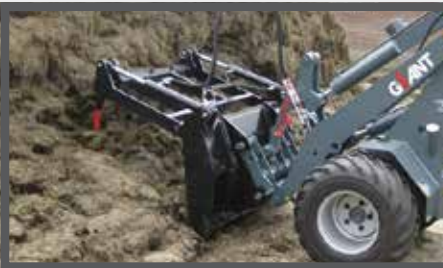
NL MESTVORKEN EN MANURE FORKS DU DUNG- UND SILLAGEZANGE FR FOURCHES À FUMIER