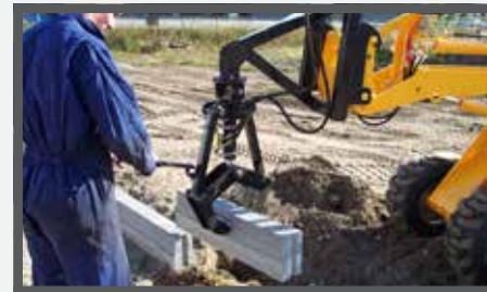
NL BANDENKLEMMEN EN STONELIFTER DU RANDSTEINZANGE FR GRIFFES POUR PNEUS