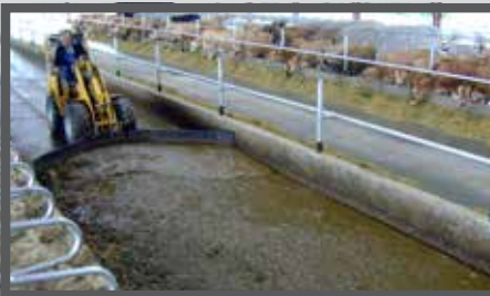
NL VOER- MESTSCHUIVEN EN FEED- AND MANURESCRAPER DU FUTTER- UND SCHMUTZSCHIEBER FR LAME À FOURRAGE - FUMIER