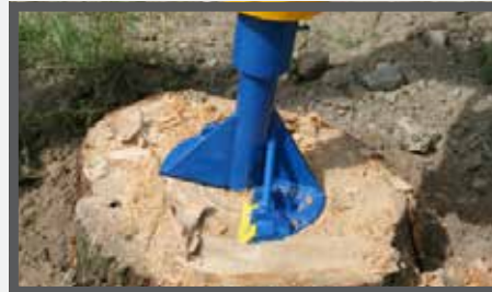
NL STOBENBOOR EN STUMP GRINDER DU BAUMSTUMPSBOHRER FR DÉRACINEUR DE SOUCHES