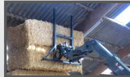
NL BALENVORKEN EN BALE FORKS DU BALLENSPIES FR FOURCHES À BALLES