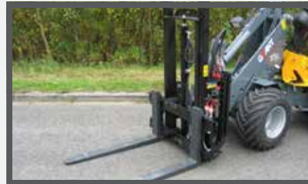
NL HEFMASTEN EN PALLET LIFT DU PALLETENHUBSTAPLER FR MÂTS DE LEVAGE