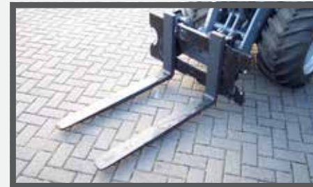
NL PALLETVORKEN EN PALLET FORKS DU PALETTEGABEL FR FOURCHES À PALETTES