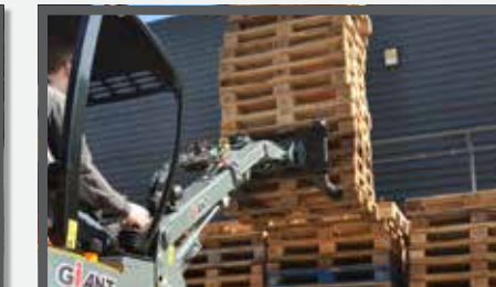
NL PALLETVORKEN COMPACT EN PALLET FORKS COMPACT DU PALETTEGABEL KOMPAKT FR FOURCHES À PALETTES COMPACT