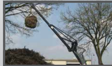
NL HJLSBOKKEN EN LIFTING ARMS DU KRANARM FR BLOCS DE HISSAGE