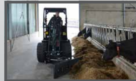
NL VOER- MESTSCHUIVEN EN FEED- AND MANURESCRAPER DU FUTTER- UND SCHMUTZSCHIEBER FR LAME À FOURRAGE - FUMIER