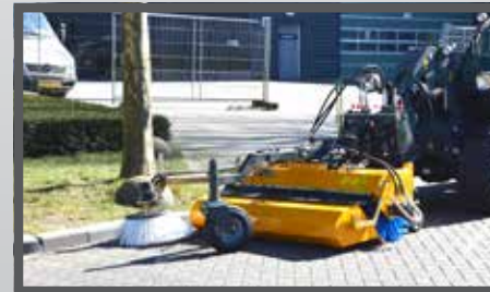
NL VEEGMACHINES EN SWEEPERS DU KEHRMASCHINEN FR BALAYEUSES