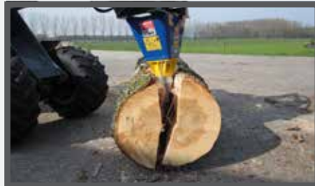
NL HOUTSPLIJTER EN LOG SPLITTER DU KEGELSPALTER FR FENDEUSE À BOIS