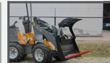
NL MESTVORKEN MET KLEM COMPACT EN MANURE FORKS WITH CLAMP COMPACT DU DUNG- UND SILLAGEZANGE KOMPAKT FR FOURCHES À FUMER, AVEC GRIFFE