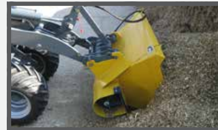
NL VOERBAKKEN EN FEED BUCKETS DU FUTTERDOSIERGERÄT FR BENNES À FOURRAGE