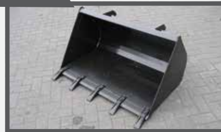
NL GRONDBAKKEN MET GESCHROEFDE TANDEN EN EARTH BUCKETS WITH BOLTED TEETH DU ERD SCHAUFEL MIT GESCHRAUBT REISSZÄHNE FR PELLES À TERRE DENTS VISSÉES