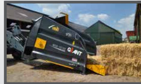
NL STROBLAZERS EN STRAWBLOWERS DU STROHGEBLÄSE FR SOUFFLEURS DE PAILLE