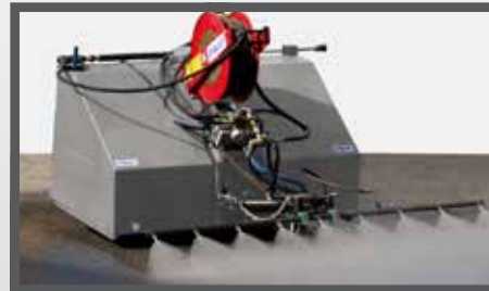
NL STRAATREINIGINGS UNIT EN STREET WASHING UNIT DU STRASSENREINIGUNGSANLAGE FR UNITÉ DE LAVAGE DE LA VOIRIE