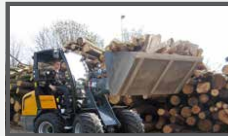
NL VOLUME BAKKEN EN HIGH VOLUME BUCKETS DU LEICHTGUTSCHAUFEL FR BENNES POUR VOLUME